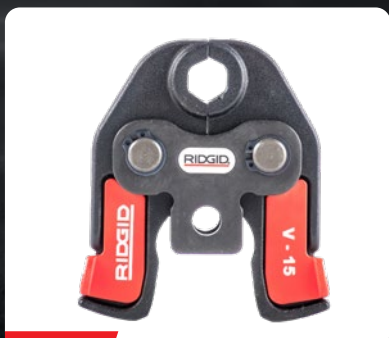
24 KN MORDAZAS COMPACTAS PARA RIDGID RP 240/241