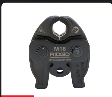
19 KN MORDAZAS COMPACTAS PARA RIDGID RP 219