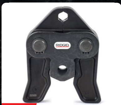
32 KN MORDAZAS ESTANDAR PARA RIDGID RP 350/351 Y RP 352-XL